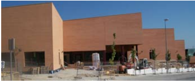
El nuevo C.E.E. Gonzalo Lafora no estará listo en septiembre