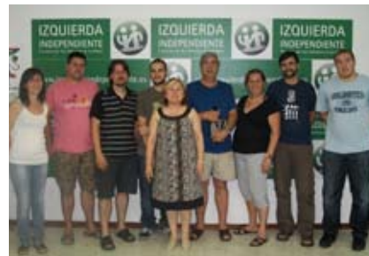
Miembros del nuevo comité de I.I.

Desde la pasada Asamblea de Junio, Izquierda Independiente cuenta con un nuevo Comité de Dirección. El grupo, elegido en una muestra de participación democrática, está compuesto por 11 personas, hombres y mujeres de la localidad, mezcla de juventud y experiencia, estudiantes universitarios,